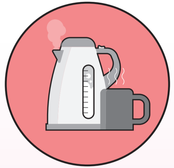
☑️ 따뜻한 물