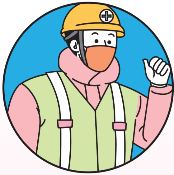
☑️ 따뜻한 옷