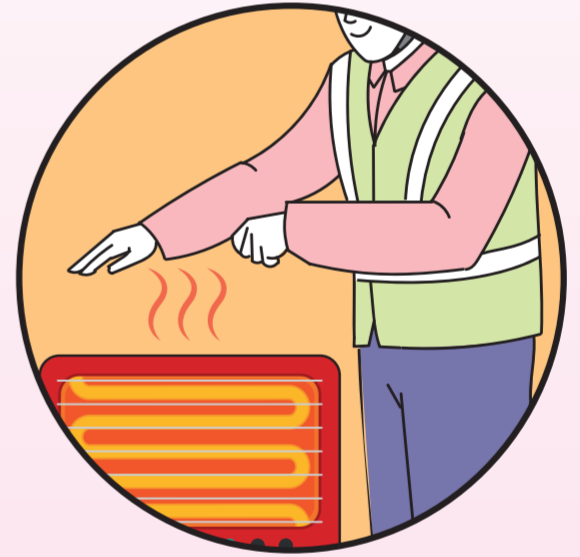
☑️ 따뜻한 장소