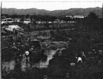
상수도공사 중 포크레인 피해