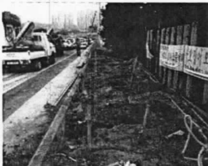
방음벽 설치 Pile공사 중 피해