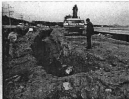
하수관거 공사 중 포크레인 피해